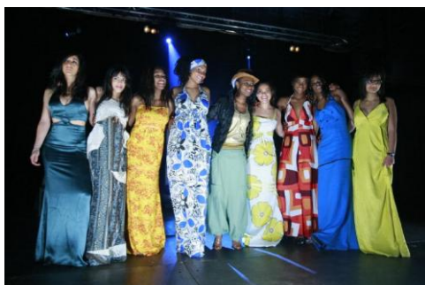
Défilé de mode par l'artiste créatrice BABELA